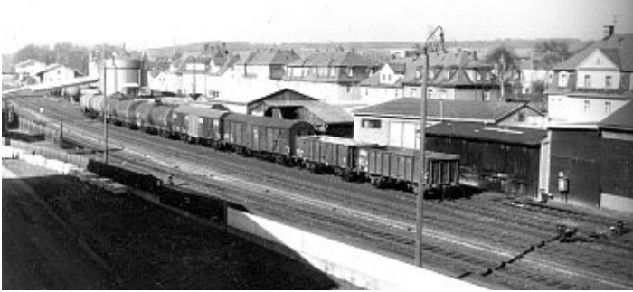
Unser Bild zeigt den früheren Freiladebereich des Güterbahnhofs. (jr)

Arbeitskreis Heimatpflege würdigt vier besondere Jubiläen