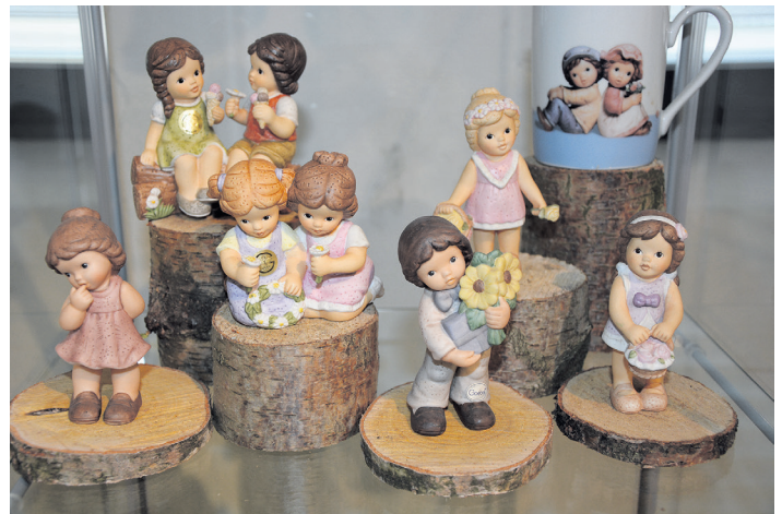
Herrliche Goebel-Figuren sind noch bis zum 2. August im Museum Mitterteich zu bewundern. Je verkaufter Figur geht ein Teilerlös an die SOS-Kinderdörfer weltweit. (jr)