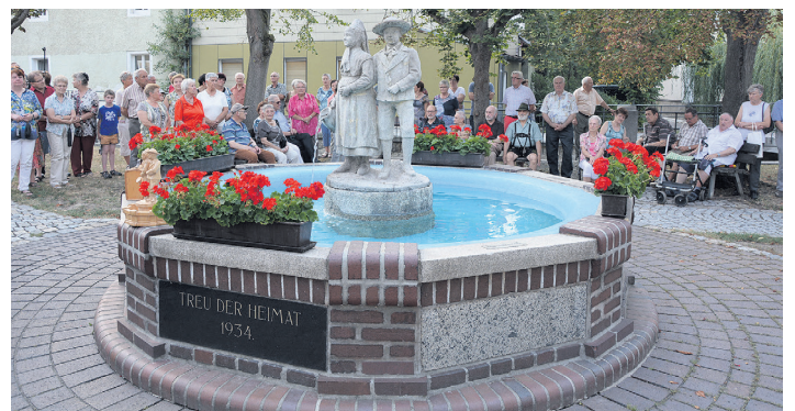
Viele Besucher waren zum Heimatbrunnen gekommen.