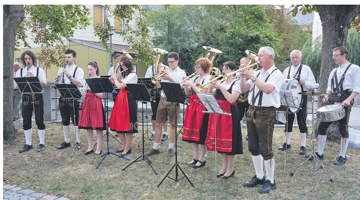
Die Stadtkapelle Mitterteich gab am Brunnen ein Standkonzert.