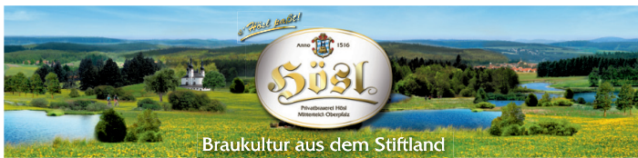
Braukultur aus dem Stiffland