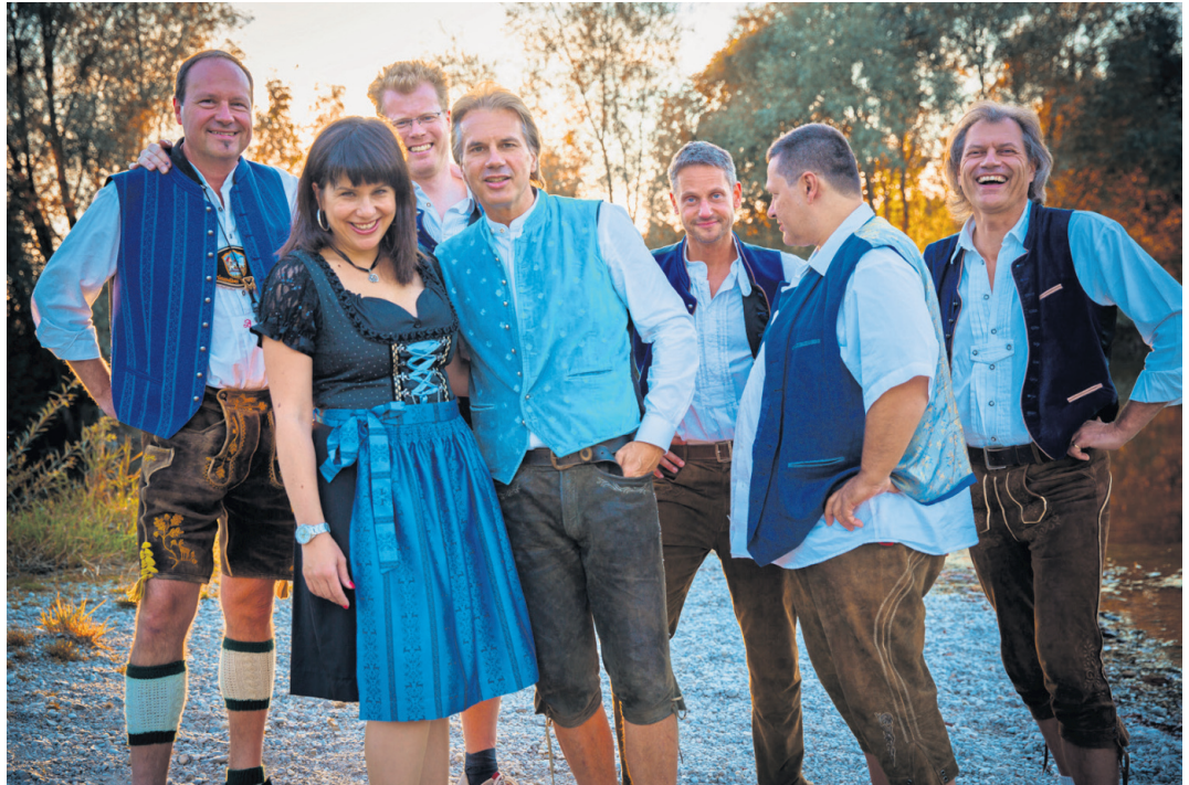
Die Partyband „Die Oberbayern“ gastiert am 7. Mai in Mitterteich, zum 1. Zoigl- und Weißbierfest bei EDEKA Legat. Es ist dies ein toller Beitrag zum Jubiläumsjahr der Stadt. Der Kartenvorverkauf für diesen Event hat schon begonnen. (jr)