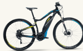
Unsere Nr. 1 im E-Bike-Bereich! Haibike SDURO ab 2.199,00 € (o. Abb.)

Ab 1. April 2016 finden Sie uns in Wölsauhammer (alte Weberei) Info: 0152/24252501