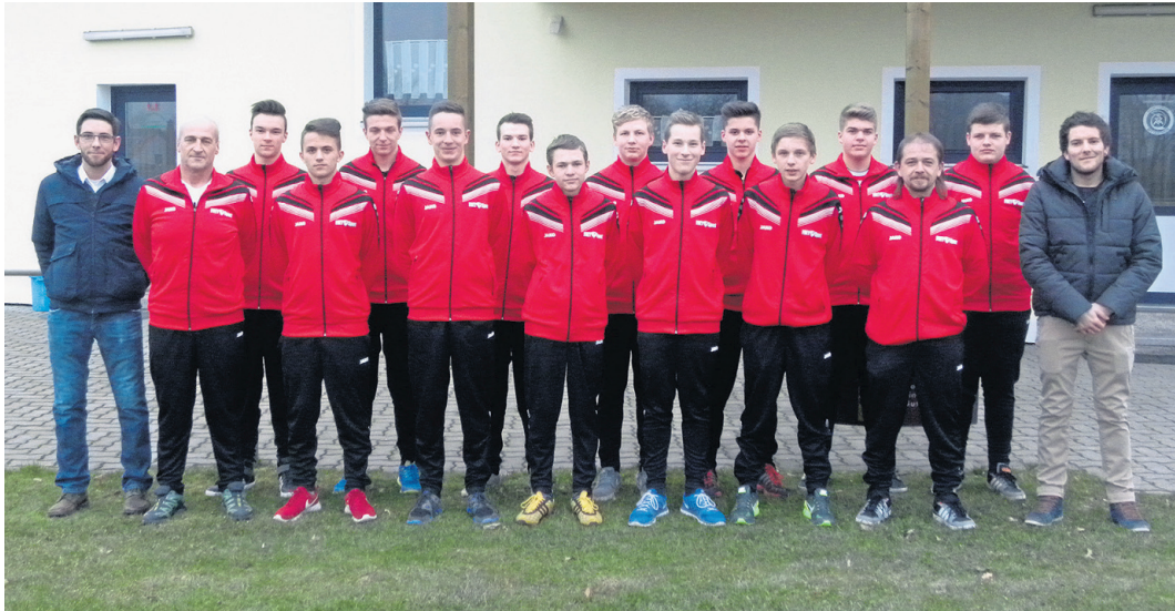
Die Firma Werkzeug Burger, Großensterz hat der B- Jugend der JFG FC Stiffland einen kompletten Satz Trainingsanzüge gesponsert. Auf dem Foto sind die beiden Betreuer der Mannschaft und die Sponsoren der Firma Werkzeug Burger und ein Teil der B- Jugend zu sehen.