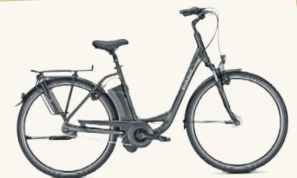
Kalkhoff E-Comfort Agattu mit Tiefeneinstieg (o. Abb.) 522 Watt, 612 Watt ab 2.150,00 € 400 Watt ab 1.850,00 € Motoren von Bosch, Impuls u. Yamaha!

Viele Eröffnungsangebote warten auf Sie!