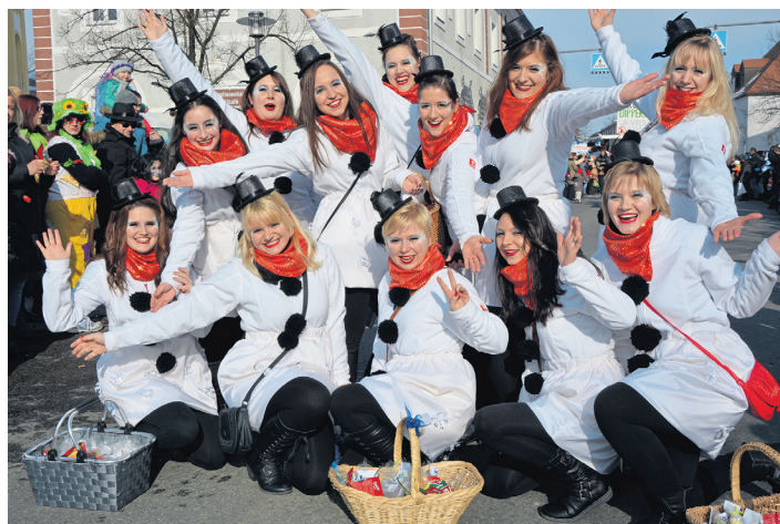
Die Showtanzgruppe X-Dream ist heuer wieder mit dabei. (jr)

ten gesorgt sein. Am Faschingsdienstag 28. Februar ist Faschingskehraus im Saal des Josefsheims, Einlass ab 18 Uhr, Beginn 19 Uhr. Neben den Auftritten des Vereins Gaudiwurm steht der Auftritt der Prinzenгарde der „Tursiana“ Tirschenreuth im Mittelpunkt des Abends. Musikalisch mit dabei ist Alleinunterhalter Klaus Rabenstein, der Eintritt kostet nur drei Euro. Näheres auf der Homepage www.mitterteicher-gaudiwurm.de