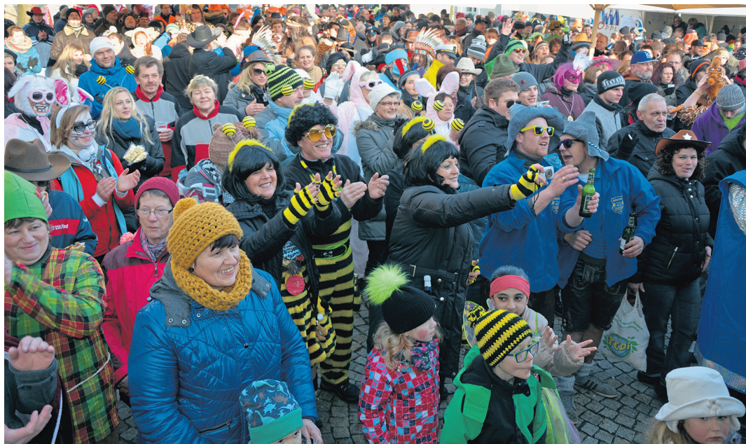
Im Anschluss an den 10. Mitterteicher Gaudiwurm steigt wieder die große Faschingsparty in der guten Stube der Stadt. (jr)