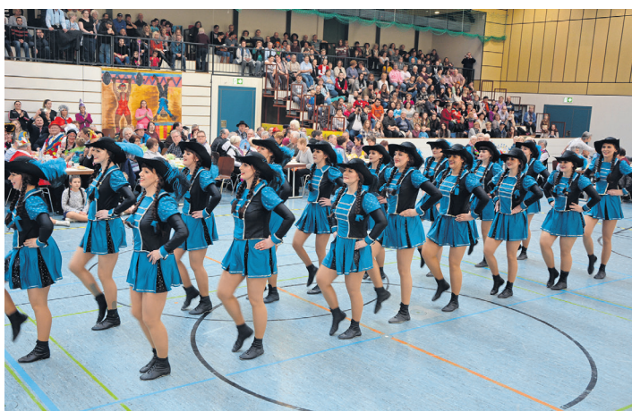
Die Prinzengarde des Vereins „Gaudiwurm“ tanzte vor vollem Haus. (jr)