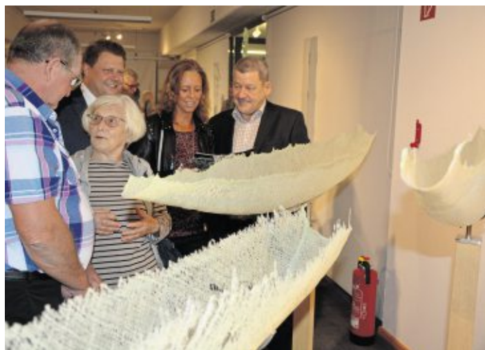
Tolle 27 Kunstwerke von Engelbert Süß gibt es jetzt noch bis zum 5. November im Museum Mitterteich zu bestaunen. (jr)

„Neues Glas, eine Ausstellung, die zu Mitterteich passt“, sagte Bürgermeister Roland Grillmeier gleich bei der Eröffnung. Nicht zuletzt deshalb, weil Engelbert Süß seine Wurzeln in der Zogigl- und Glasstadt hat. „Er ist ein original Nordoberpfälzer, der aber weit über die Region hinaus wirkt“, sagte der Bürgermeister, der dem Künstler ausdrücklich da-