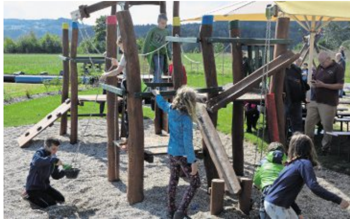
Die Kinder wissen schon längst, was sie an dem neuen Spielplatz haben.