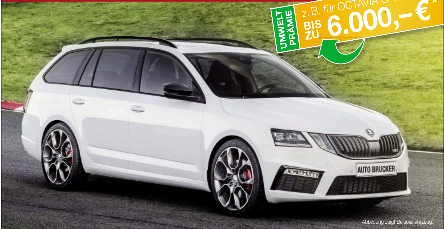
Abbildung zeigt Beispielfahrzeug.

UMWELT PRÄMIE z. B. für OCTAVIA G-TEC BIS ZU 6.000,- €*