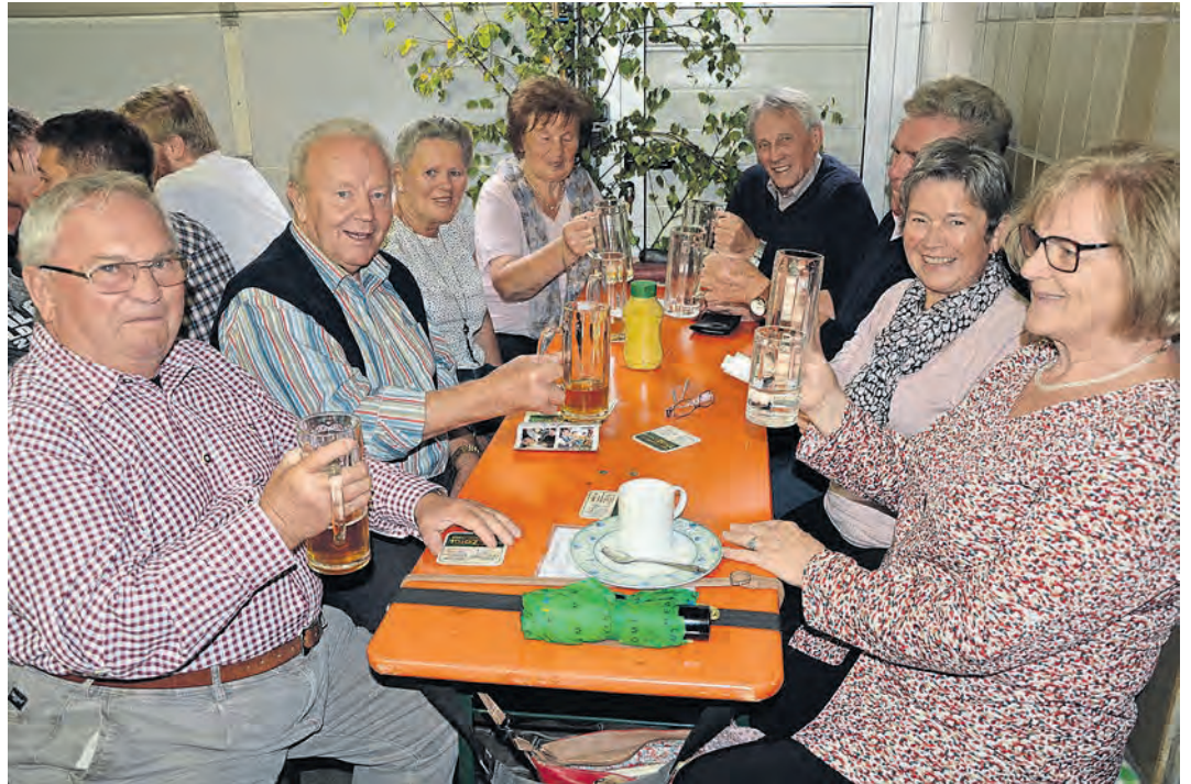
Gute Stimmung ist beim 11. Mitterteicher Kommunbrautag am Sonntag, 22. September garantiert. Die drei Mitterteicher Zoiglstuben laden zu frisch gezapften Zoiglbier und deftigen Brotzeiten ein. Für eine urige Stimmung sorgen Musikanten in den Zoiglstuben. (jr)

Beim Kommunbrautag mit dabei sind die drei Original-Kommunbrauer der Zoiglbierstuben Oppl, Hartwich und Lugert. Der Eintritt in alle drei urigen Stuben ist frei. Beginn ist jeweils um 10 Uhr. Alle Zoiglstuben bieten ganztägig deftige Brotzeiten und