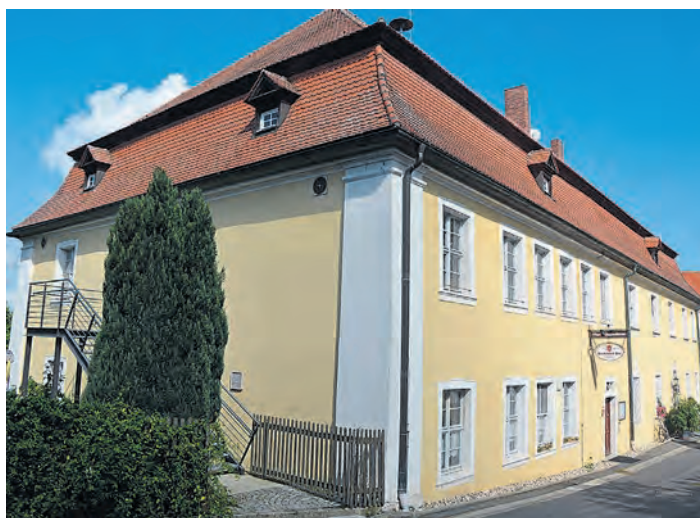
Attraktiv gestaltet ist das Pfarr- und Jugendheim in Leonberg. Jetzt können die Räumlichkeiten von Jedermann für Feiern auch privater Art gemietet werden. (jr)

Leonberg. (jr) Neu belebt werden soll das Pfarr- und Jugendheim in Leonberg. Nach der aufwändigen Sanierung im Jahr 2015 und der kirchlichen Segnung im Januar 2016 hofften Pfarrei und Gemeinde auf eine Wiederbelebung der einstigen Gaststätte mit Saal. Leider wird die Nutzung bislang nicht so angenommen wie erhofft. Deshalb haben sich beide Betreiber, Kirche und Gemeinde, dazu entschlossen einen neuen Flyer herauszugeben, in der Hoffnung die „Location“ neu beleben zu können.