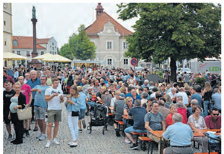
Menschen über Menschen bevölkerten den Unteren Marktplatest. (jr)

zum Kauf im Raum WEN/TIR/MAK/WUN/SELB HEROLD Immobilienmanagement Telefon 0151 54834895