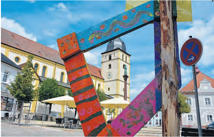
Durch(g)schaut durch einen Bilderrahmen am Unteren Markt in Richtung Stadtpfarrkirche. (jr)

Kinder und Jugendliche stellen selbst gestaltete Bilderrahmen im Stadtgebiet auf