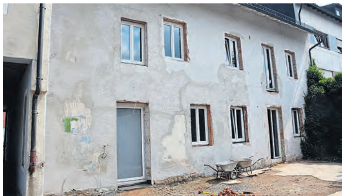
Hier an der Außenhaut des Gebäudes im Innenhof werden noch eine Terrasse und ein Balkon angebaut. Ab ersten Quartal 2020 können beide Wohnungen dann bezogen werden. (jr)

lungszentren wieder zurück in die Heimat wollen. Aber auch ältere Bürger haben Interesse an barrierefreien Wohnraum, weiß der Rathauschef.