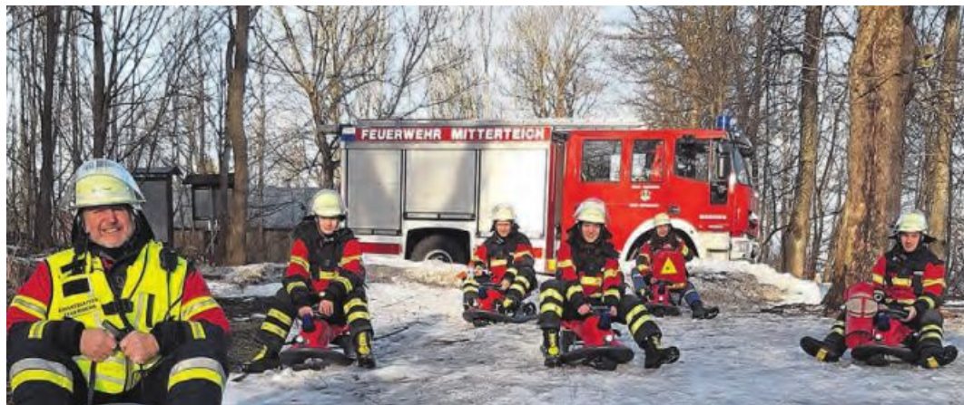
Schon jetzt proben die Aktiven der Feuerwehr Mitterteich für ihren ersten Einsatz. Gerettet werden soll vor allem Bobbilotinnen. (jr)

Diese können Einsatzstellen erreichen, wo sonst keine Feuerwehr Radfahrzeuge die Unglücksstelle anfahren können. Auch wegen den Corona Verordnungen wurden sechs solcher Fahrzeuge für eine Staffelbesetzung (1/5) beschafft, damit jeder einzeln mit seiner Ausrüstung die entlegenen Einsatzstellen anfahren kann und den nötigen Abstand einhalten kann. Nachdem die FFW Mitterteich immer wieder vor schwierigen Einsatzsituationen steht, sind diese neuen Einsatzgeräte für dieses Jahr genau die richtige Investition, da die Bevölkerung viel mit Rodelbobs und –schlitten auf vielen Berghängen und Waldstrecken unterwegs war. Dies bestätigte auch der aktuelle Leitstellenbericht der ILS Nordoberpfalz!