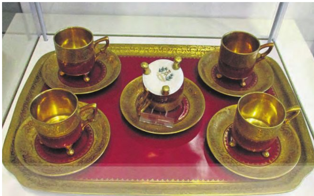
Das Service „Ätzkante“ gibt es ebenfalls zu bewundern. (jr)

In den vergangenen Wochen und Monaten wurde die Museumseinrichtung auf Vordermann gebracht. Ein neuer Schaukasten mit Skizzen, sowie Entwürfen und Dekorvorlagen aus der ehemaligen Porzellanfabrik werden da präsentiert. Hinzu kommt eine neue Vitrine mit Exponaten der Original „Ätzkante“. Noch bis zum 18. April ist die Sonderausstellung „Fantastische Hand-