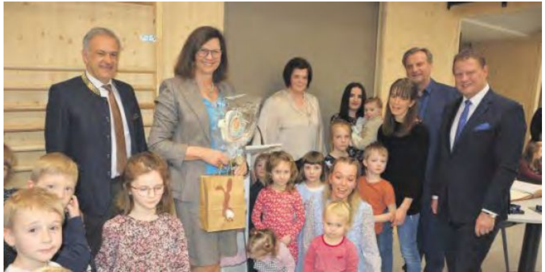
Kinder des „Purzelbaum“ überreichten Landtagspräsidentin Ilse Aigner Geschenke und dankten für ihren Besuch.