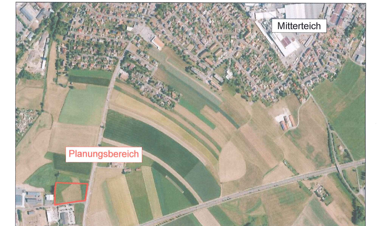
Übersichtslageplan, M 1:10.000

FLURNR.: 1321 und 1350 (TF) DER GEMARKUNG MITTERTEICH