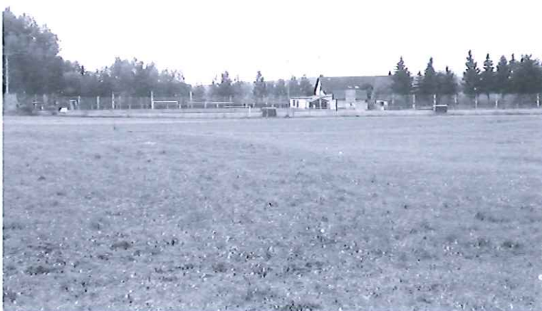
Blick von Osten auf das Sportgelände

Die Fläche liegt eben ohne nennenswerte Fernwirkung zwischen B 299 und einer Splitter-siedlung innerhalb eines bestehenden Sportgeländes: