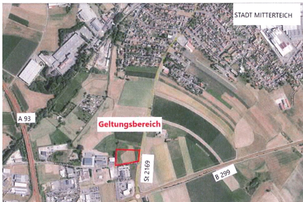
Luftbild mit Umgrenzung - Lage des Planungsgebietes (rot) o.M.

Der räumliche Geltungsbereich des Bebauungsplanes mit integriertem Grünordnungsplan für das Gewerbegebiet „Birkteichwiesen 1“ ist aus nachfolgendem Kartenausschnitt ersichtlich.